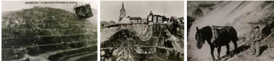
Bilder und Modell im Musee Regional