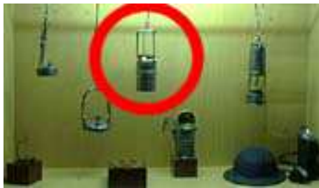
Information im Internet 12.2011

Im zweiten Stock fand ich die Abteilung „La Mine“ und die ersehnte Vitrine.