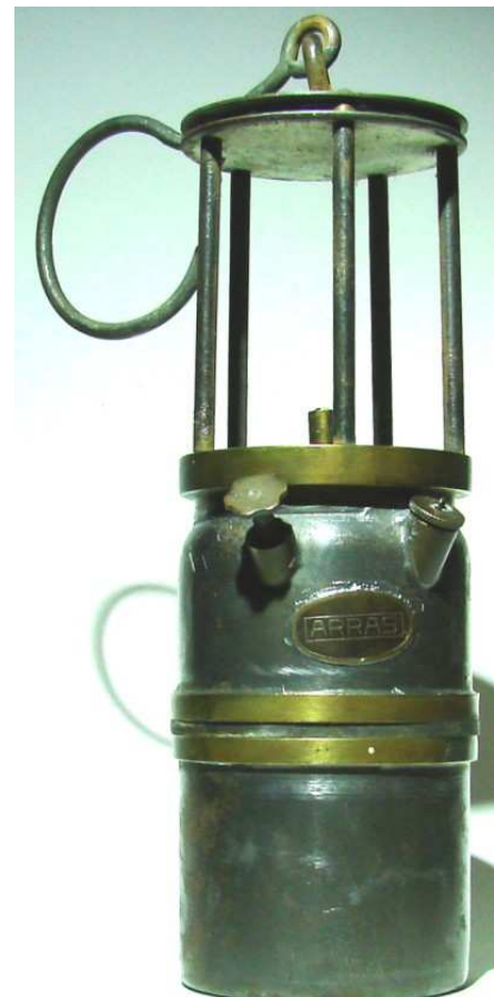
Modell la Mure >> ARRAS