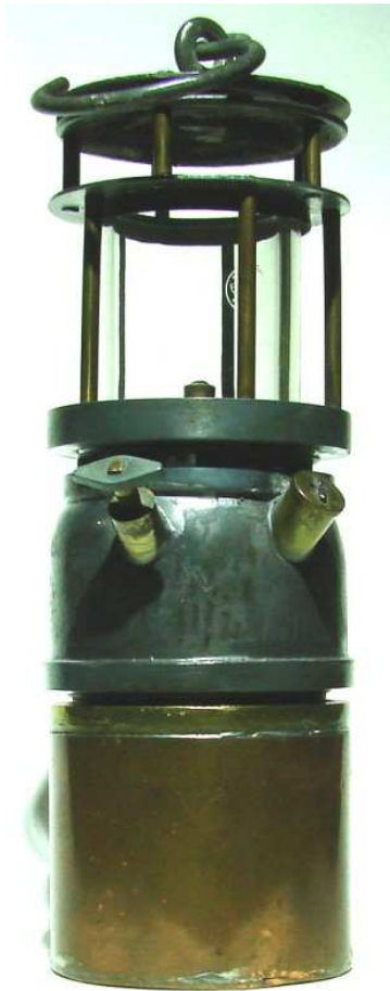
Hubert Joris Oberteil teilweise aus Magnalium