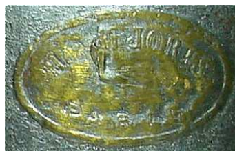
<< Firmenschild Joris