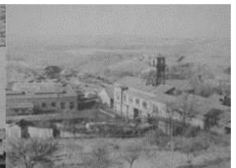
Puits de Cagnac les Mines