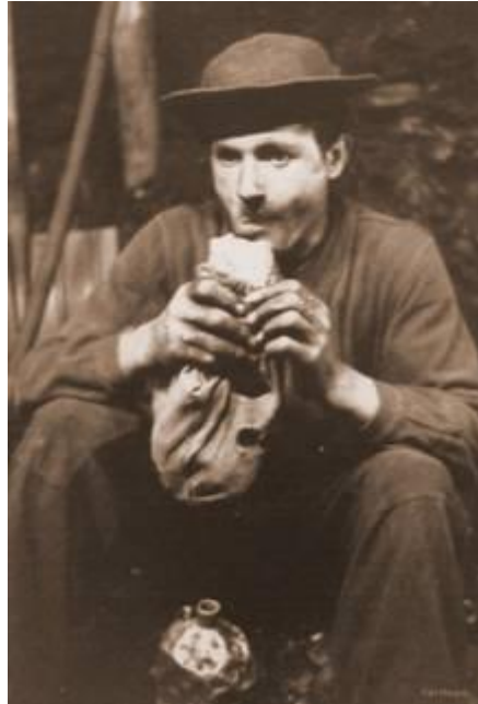
Bergleute bei der Halbschicht. Wie schwer die Arbeit war lässt sich am Bild rechts ablesen.