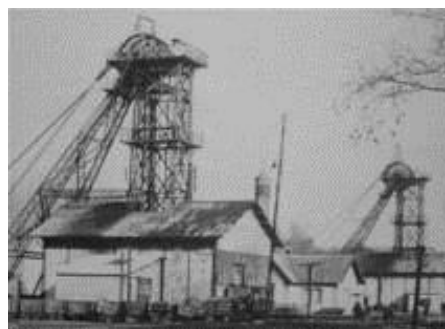
Puits de Sainte Marie