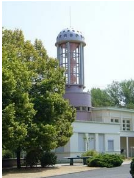
Landmarke und Aussichtsturm