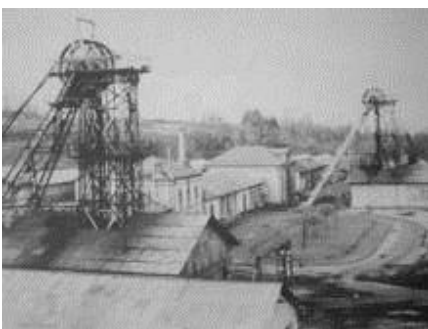
Puits de la Grillatié