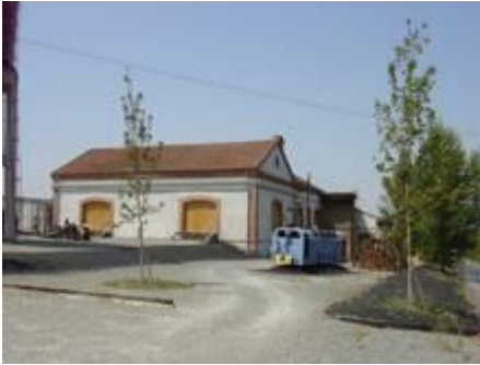
Musee de la Mine