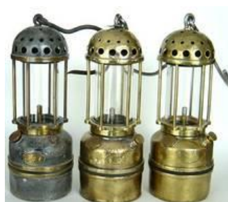
Plakette der Arras-Lampe