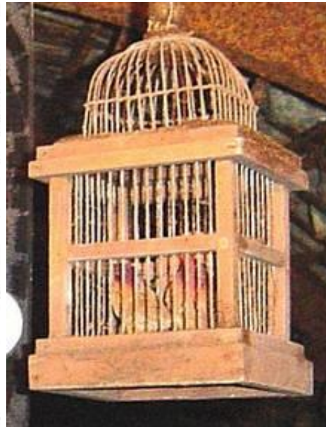
Käfig für Kanarienvogel