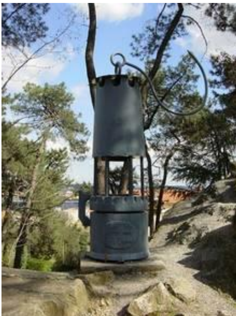
Lamp de Mineur