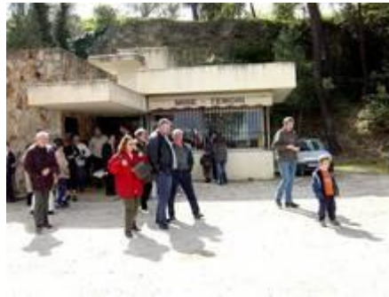
Besucher des Schaubergwerks