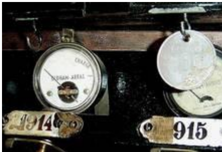
Zu Arbeitsbeginn nahm er seine aufgeladene Lampe und hängte stattdessen eine Fahrmarke an den Aufladestand.