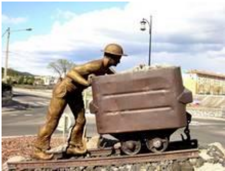
Bereits an der Straße grüßt ein Mineur