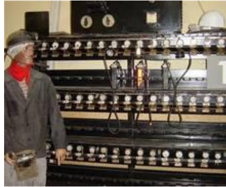
Jeder Bergmann hatte eine eigene Grubenlampe.