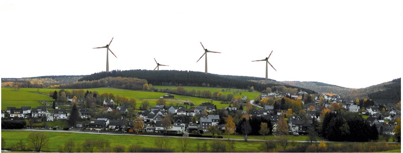
Link zur Bürgerinitiative Flammersbach / Anzhausen Windkraft mit Abstand

den weiteren Planungen und Entscheidungen von Kommunen und Verwaltung wachsam sein. Vielleicht kommt ja doch noch das „Pilatus-Prinzip“ nach der Kommunalwahl in NRW zum Tragen? Westfälische Rundschau 26.03.2014___.pdf Siegener Zeitung 27.03.2014___.pdf