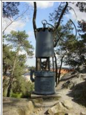
Mine Temoin à Ales