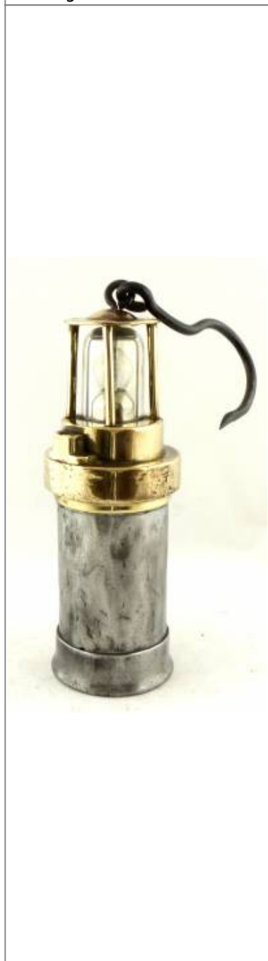
Dominit TYP B.O.