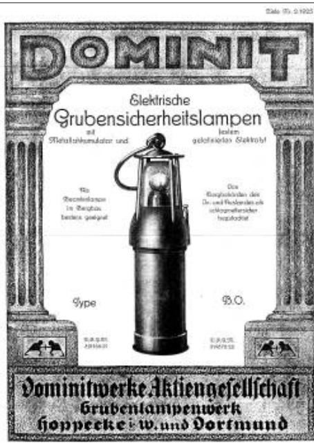
Katalogseiten von 1925