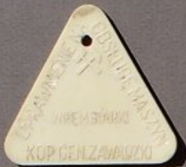
KOP. GEN. ZAWADZKI Grube WREMBIARKI Gruppe General Zawadzki