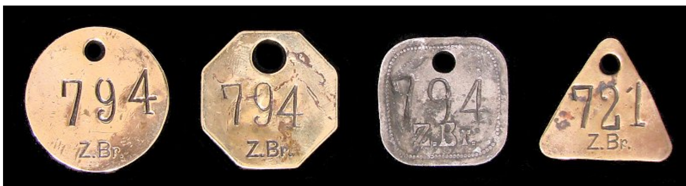
Selten gelingt es einen kompletten nummerngleichen Satz an Schichtmarken zu erhalten.