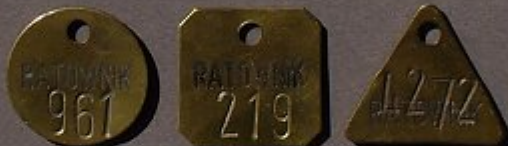
Früh- Mittag- Nachtschicht Grube RATOWNIK