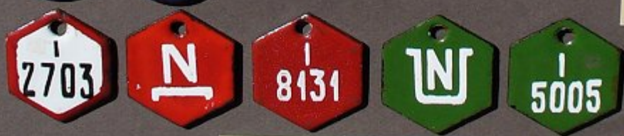
Gruben der Gruppe General Zawadzki