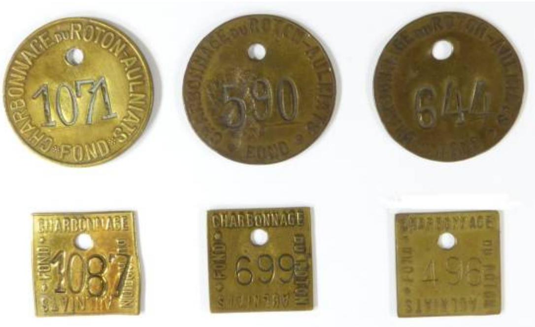
(région de Charleroi)