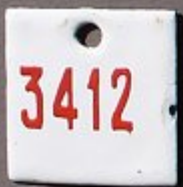
Zeche Emma - Grube Steinkohlen - Grube Losian, Oberschlesien jetzt: KWK Marcel Wodzistaw, Polen