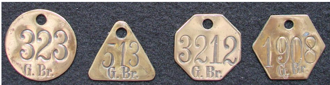
Reihenfolge: - Schichtmarke - Fahrmarke - Schichtmarke - Schichtmarke - G. Br. = Grube Brassert

auf den Schichtmarken. Alte Formen müssten kleinere Nummern aufweisen als Neue Formen. Das stimmt aber so nicht wie man an den Fotos sehen kann. Das ist nur dadurch zu erklären, dass Marken verloren gehen und ersetzt werden müssen.