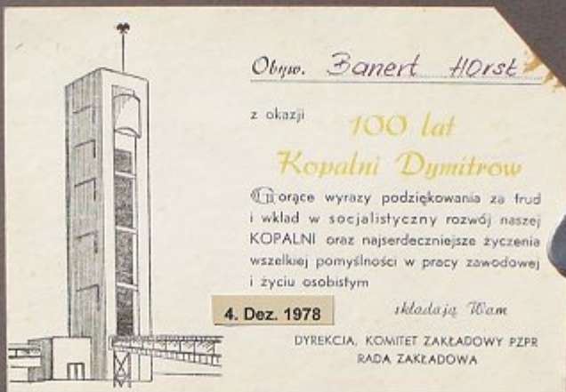
KOPALNIA "DYMITROW" = Grube Dymitrow