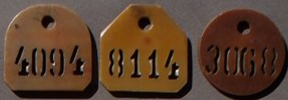
KWK - GEN. ZAWADZKI = Gruppe General Zawadzki