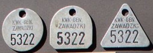
ZWK - GEN. ZAWADZKI Grube General Zawadzki