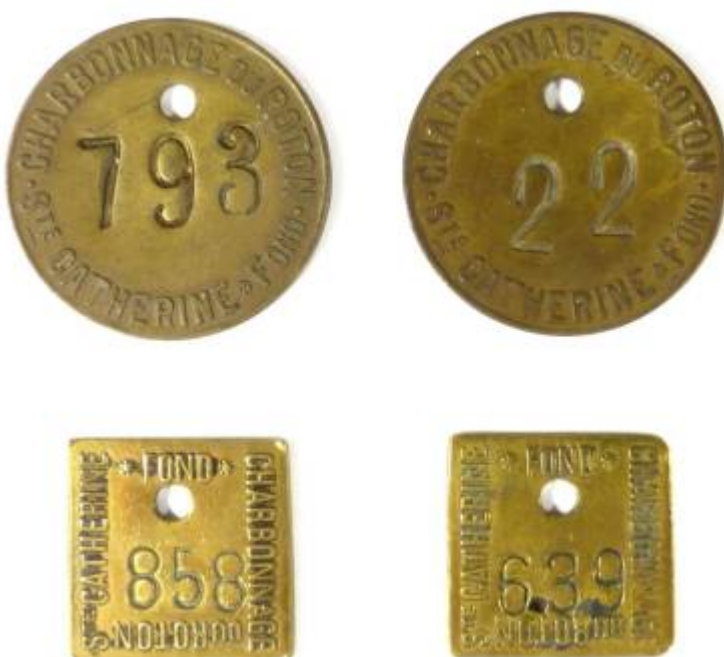
Le Borinage (Région de Mons)