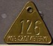
KOP. SZOMBIERKI = Grube Szombierki