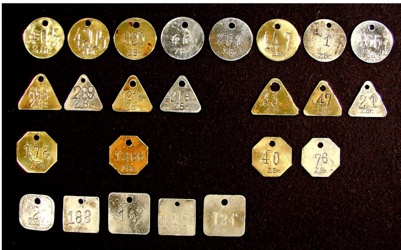
Wie unterschiedlich Fahr- und Schichtmarken sein können wird an diesem Bild deutlich. Im Bereich